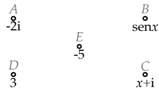
Fig. 1.- Puntos con valores asignados.

Pero, obsérvese que (1) es cero siempre, sin ningún requisito para los números v_A , v_B , ..., v_E . Se debe a que cada uno aparece en (1) dos veces, una con signo positivo y otra con signo negativo. Da igual, por tanto, de qué magnitud sean medida. Da igual que sean potenciales eléctricos o no, que la magnitud se conserve o no. Más aún, da igual que sean medida de alguna magnitud o no. Ocurre siempre. Es propiedad de cualquier conjunto de diferencias de valores, asignados a puntos o no, sea lo que sea lo que indiquen o sin indicar nada. Incluso esos valores pueden ser números complejos, funciones reales, funciones complejas, vectores... 2 . Así ocurre en la figura 1. La suma de las diferencias de esos valores en el camino cerrado ABCD es