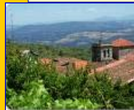
Sierra de Francia