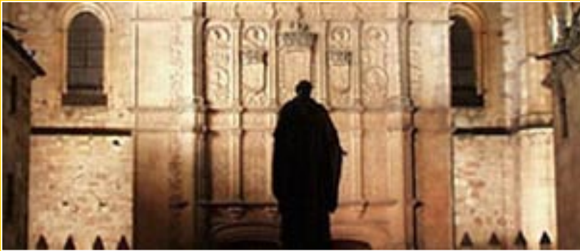
Fachada de la Universidad y estatua de Fray Luis de Leon

La Universidad Salmantina, consciente de su milenaria historia e impacto ejercido en la configuración gramatical del idioma español como lengua universal y tras-atlántica, y sabedora de su relevante influjo histórico en la construcción de las bases legislativas del naciente Estado Moderno iniciado por los Reyes Católicos, pretende en la actualidad poder contribuir a seguir siendo faro de Occidente y de Latino-América en el descubrimiento y difusión del conocimiento a través de la lengua universal de Cervantes.