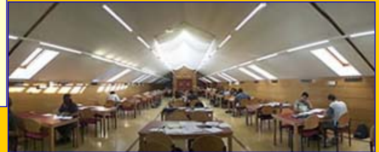
Biblioteca del Campus Viriato

La exigencia de desarrollar un Proyecto Fin de Máster a lo largo del curso por parte del alumno, como otra parte de los créditos prácticos que deberá realizar podrá cumplirse de forma más satisfactoria gracias al potencial que brinda el poder utilizar la red bibliotecaria de una de las Universidades mejor dotadas de España.