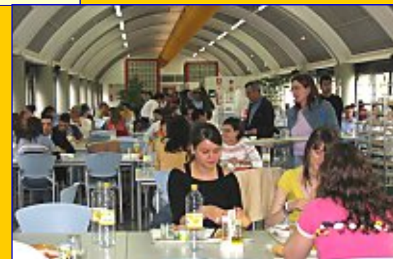
Comedor del Campus