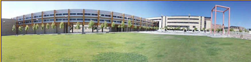
Biblioteca Francisco Vitoria