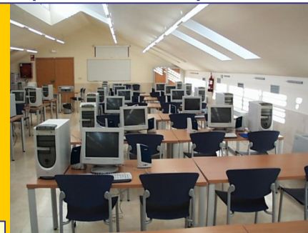
Salas de Informática