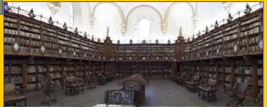
Biblioteca General (Edificio Histórico)