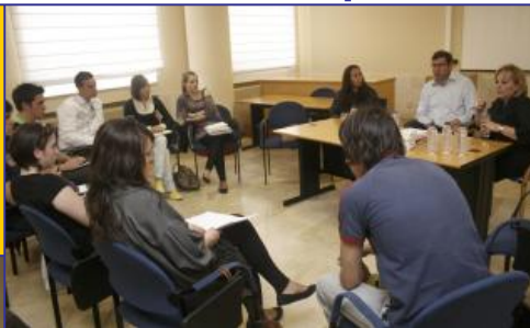
Aulas del Campus