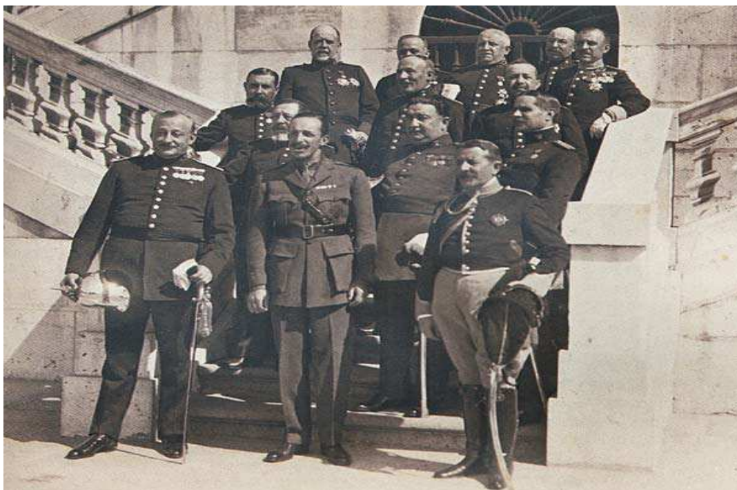
Alfonso XIII y Primo de Rivera con los ministros del Directorio Militar

* A partir de sus conocimientos y del material adjunto desarrolle el tema: El reinado de Alfonso XIII: la crisis de la Restauración (1902-1931) (Intentos de modernización. Regeneracionismo y revisionismo/ La quiebra del sistema: conflictividad social y crisis de 1909, 1917 y 1921/ La Dictadura de Primo de Rivera). Valoración máxima: 6 puntos.