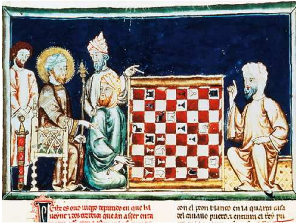
El libro de los Juegos. Alfonso X el Sabio

* A partir de sus conocimientos y del material adjunto desarrolle el tema: La Península Ibérica en la Edad Media: los reinos cristianos (siglos VIII al XIII) (Origen y evolución de los primeros núcleos de resistencia. El nacimiento de León y Castilla / Expansión y formas de ocupación del territorio. Modelos de repoblación y organización social. La Mesta / Las tres culturas peninsulares). Valoración máxima: 6 puntos.