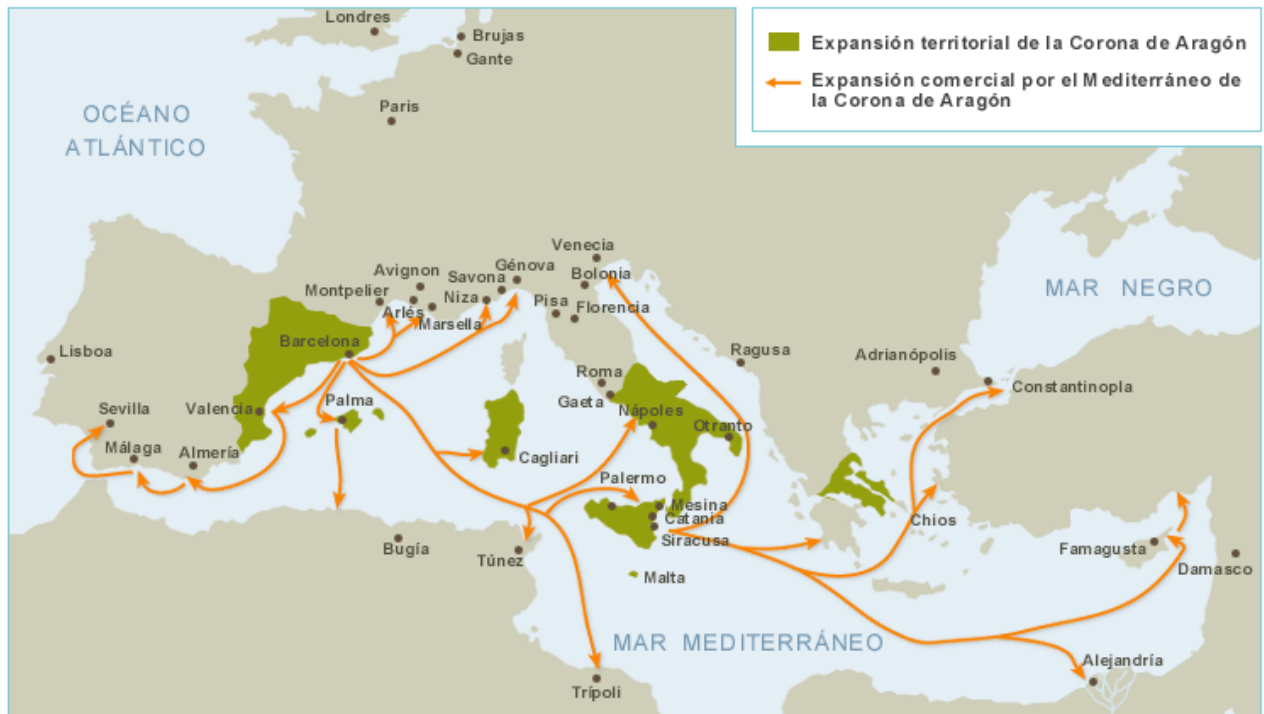
Expansión marítima de la Corona de Aragón por el Mediterráneo

* A partir de sus conocimientos y del material adjunto desarrolle el tema: La Baja Edad Media. La crisis de los siglos XIV y XV (Organización política e instituciones de gobierno / Crisis demográfica, económica y política / La expansión de la Corona de Aragón en el Mediterráneo / Las rutas atlánticas: castellanos y portugueses. Las islas Canarias). Valoración máxima: 6 puntos.