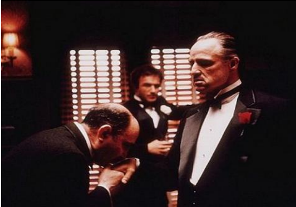
El padrino (The Godfather, F. F. Coppola, 1972)

ESTA IMAGEN PUEDE ESTAR SUJETA A DERECHOS DE AUTOR